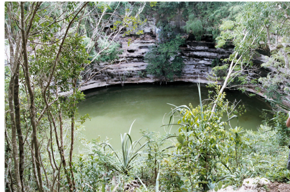
Cenote Sagrado de Chichén Itzá.

Entre 1175 y 1185 la liga comenzó a desintegrarse cuando uno de los cocomes llamado Ah Ceel Cauich, en una de las ceremonia fue arrojado al cenote sagrado de los itzáes, que se consideraba la entrada al inframundo. Pero regresó con vida y se proclamó Ahaw ó guía espiritual de Mayapán, tal como si fuera la divinidad Ah Mex Cuc, entonces comenzaron a considerarlo halach uinik (“hombre verdadero” jefe militar y sacerdotal) y se le conoció con el nombre de Hunac Ceel Cauich .