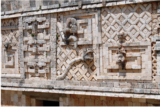
kaan 'serpiente', Pech 'garrapata'.

Can Pech o Kaan Peech fue una jurisdicción de la cultura maya, que se formó tras la desintegración de la Liga de Mayapán, en el período posclásico, tomó el nombre de su principal población y puerto. Su ubicación era al sur de la jurisdicción de Ah Canul y al norte de Chakán Putum en el litoral del golfo de México. En el siglo XVI, durante la conquista, fue un punto estratégico para el avance de los conquistadores. El nombre actual de la población de Can Pech es San Francisco de Campeche capital del estado mexicano de Campeche. Los vestigios arqueológicos en la zona indican que fue habitada desde el período preclásico y clásico de la civilización maya. [1]